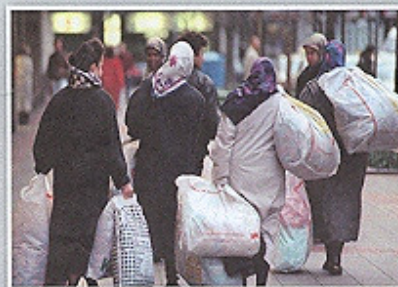
Heute sind wir tolerant, morgen fremd im eigenen Land!

In unseren Klassen, gerade an Haupt- und Realschulen, herrscht ein regelrechter