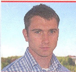
Frank Franz Initiative „Rechts vor Links“

Wir lassen uns von diesem System nicht länger unterdrücken!